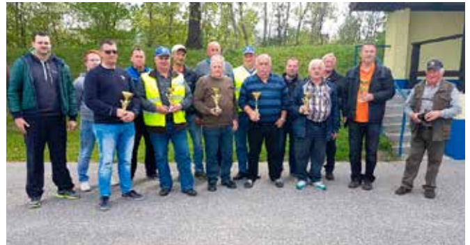
Skupinski posnetek ekipe ZŠAM Laško

Zahvala gre tudi NZZŠAM Slovenije in ZŠAM Savinjske doline za zelo kakovostno organizacijo tekmovanja. Se vidimo prihodnje leto. Srečno vožnjo!