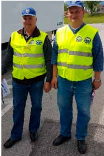
Člana sodniške ekipe

Ekipno je naše združenje osvojilo drugo mesto, za kar se vsem tekmovalcem iskreno zahvaljujemo in jim čestitamo.