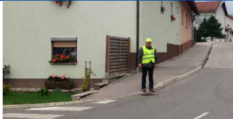
Varovanje šolskih otrok, september 2016

V poročilu o delu društva je predsednik poudaril predvsem akcije, v katerih je sodelovalo 23 članov