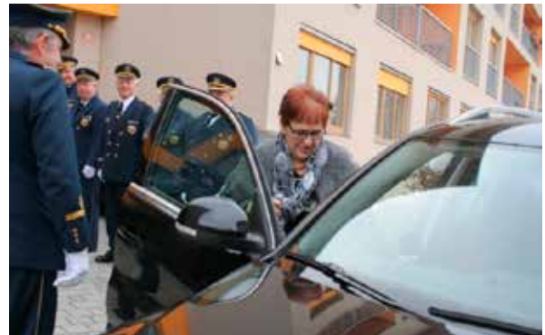
Prevoz starostnikov, marec 2017

vključevanje ZŠAM Slovenj Gradec in Doma starostnikov Slovenj Gradec v projekt prostovoljnega prevoza starejših občanov.