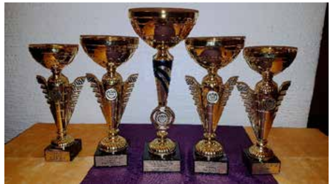
Osvojeni pokali tekmovalne ekipe ZŠAM Laško

Ekipno je naše združenje osvojilo drugo mesto, za kar se vsem tekmovalcem iskreno zahvaljujemo in jim čestitamo.