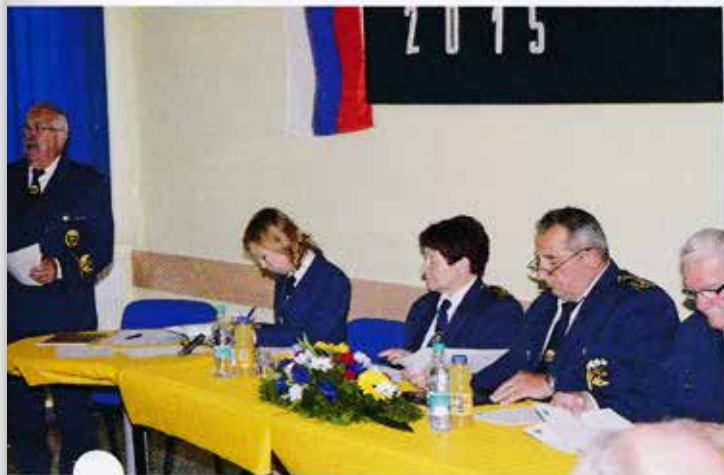
Z letnega zбора

Na drugem letnem zboru so se sestali člani in članice ter gostje Neodvisne zveze združenj šoferjev in avtomehanicov Slovenije (NZZŠAMS), ki ima svoj sedež v prostorih Združenja šoferjev in avtomehanicov Savinjske doline (ZŠAM) v Ločici ob Savinji.