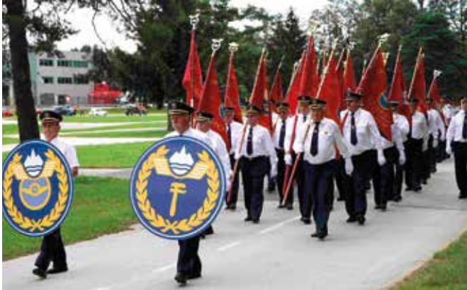
Parada na proslavi ob 60. obletnici.

27. februarja 1999 se je društvo ZŠAM Žalec preimenovalo v ZŠAM Savinjska dolina. Vzrok za to je bil razpad velike občine Žalec na manjše posa-