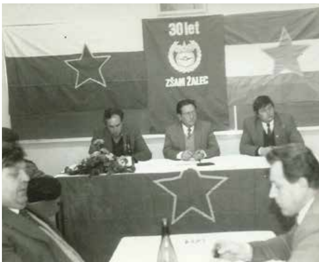
Občni zbor ob 30. obletnici, takrat še ZŠAM Žalec.

veliko dela. Luč sveta so zagledale učilnica, pisarni in klubska soba. V letu 1986–1988 je bila urejena še avtomehanična delavnica, ki je bila namenjena