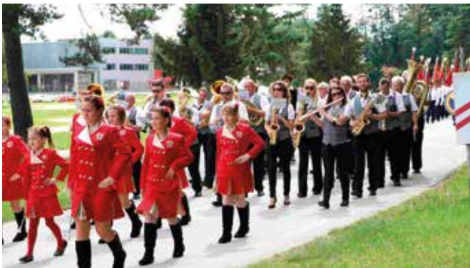
Mažoretke in godba iz Laškega.