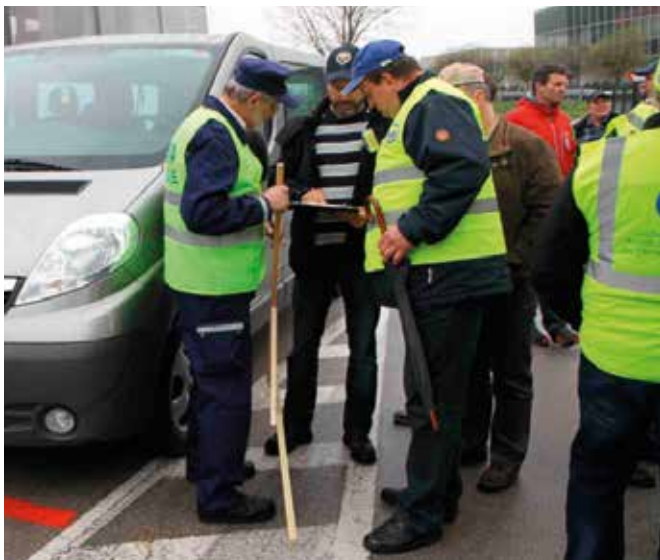
Državno tekmovanje šoferjev in avtomehanikov.

V Združenju ZŠAM Savinjska dolina so trenutno 204 člani. Pri svojem delu si prizadevamo predvsem za izobraževanje članov, organiziramo tekmovanja šoferjev in avtomehanikov na državni ravni, izvaja-