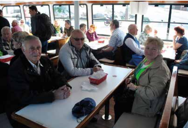
Izlet na Goli otok 2016.