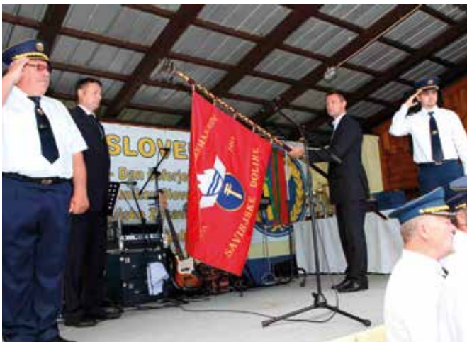
Razvitje prapora ob 60. obletnici ZŠAM Savinjska dolina.

mezne občine (Polzela, Vransko, Tabor, Prebold in Žalec). Naša stanovska organizacija je kljub temu ostala trdna, je uspešno povezovala vse novo nastale občine in nemoteno nadaljevala z delom.