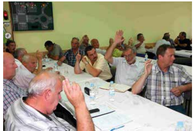
Delegati ustanovne seje NZŠAM Slovenije.

dnevni izlet na Češko, kjer smo si ogledali Prago in tovarno avtomobilov Škoda.