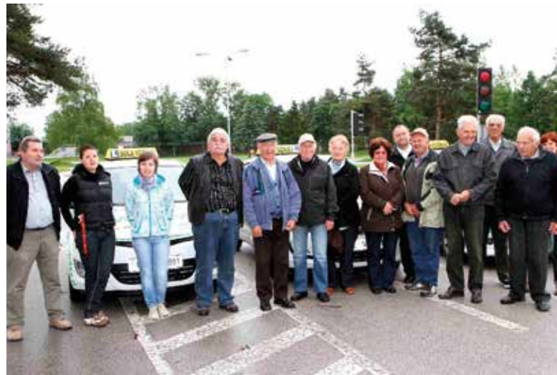
Teoretično in praktično izobraževanje starejših nad 60 let.

mo preventivne akcije v sklopu nacionalnega programa, organiziramo različna izobraževanja starejših, motoristov in kolesarjev v sodelovanju s šolo vožnje Verdev. Uspešno sodelujemo z Javno agencijo Republike Slovenije za varnost prometa, SPV-ji po vseh občinah in policijo Žalec, ki nam pomagajo pri strokovni izvedbi naših aktivnosti. Naša poglobljena naloga je prizadevno delovanje na področju prometne varnosti vseh udeležencev v cestnem prometu.