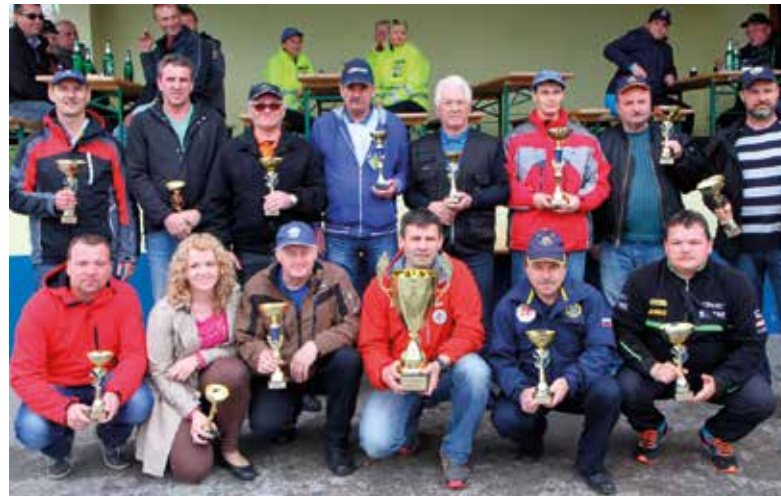
Prejemniki pokalov na državnem tekmovanju 2016.