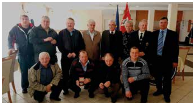
Prejemniki stažnih značk in plaket.