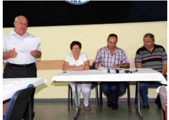
Ustavna seja Neodvisne zveze ZZŠAM Slovenije.

Leta 2015 smo člane združenja popeljali na dvo-