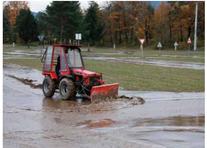
Čiščenje poligona po poplavah.

Po končani sanaciji člani društva niso sedeli križem rok in so se že naslednjega leta lotili gradnje nove-