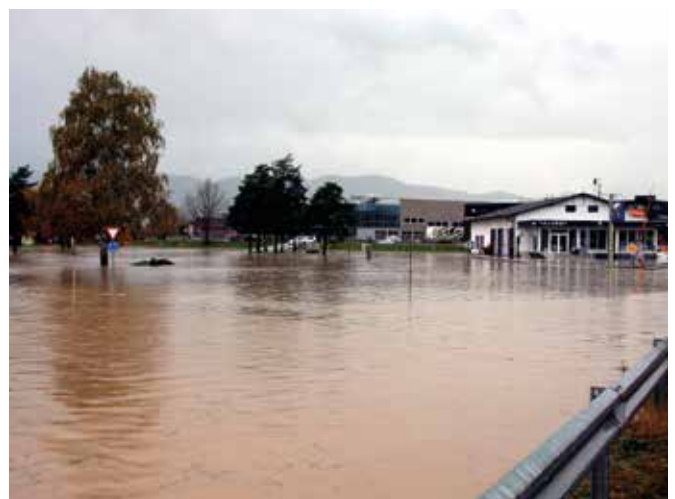
Raven vode ob poplavah je dosegla 1,20 metra.

veliko dela. Luč sveta so zagledale učilnica, pisarni in klubska soba. V letu 1986–1988 je bila urejena še avtomehanična delavnica, ki je bila namenjena