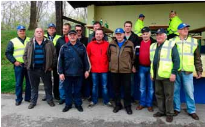
Tekmovalci in sodniki iz ZŠAM Laško

Čeprav nam vreme ni bilo najbolj naklonjeno, se nas je kljub temu zbralo kar lepo število iz različnih združenj, kakor tudi nekateri posamezniki. Naši tekmovalci so se