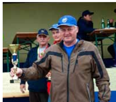
Pokal za doseženo 2. mesto

Tudi letos smo se tekmovalci iz ZŠAM Laško 9. aprila 2016 v Ločici ob Savinji pomerili z ostalimi združenji v znanju cestno prometnih predpisov in spretnosti vožnji. Za razliko od prejšnjih let, ko smo bili še pod okriljem Zveze ZŠAM Slovenije in v Celjsko – Zasavski regiji,