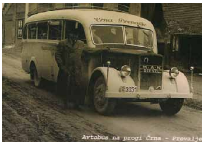
Avtobus na progi Črna - Prevalje