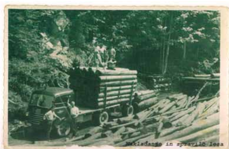
Nakladanje in spravlilo lesa