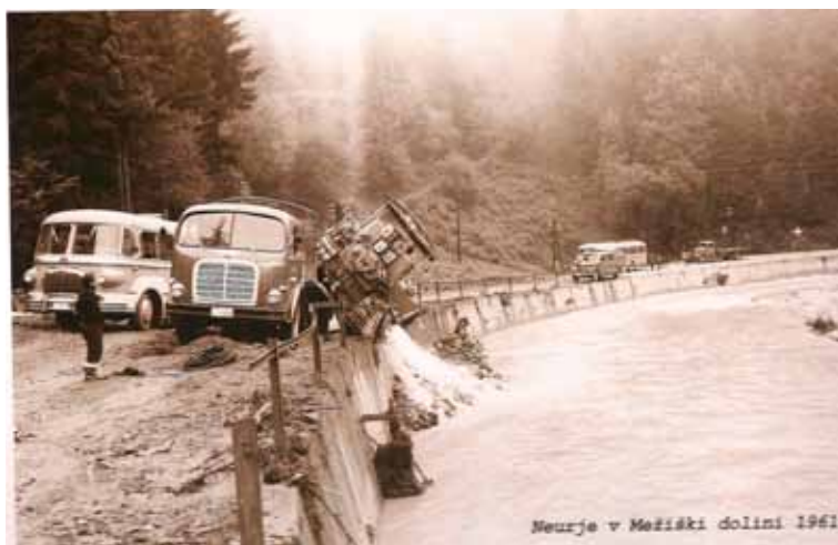
Neurje v Mežiški dolini 1961

Fotografski utrinki, ki so nastali v šestdesetih letih prejšnjega stoletja, kažejo, s kakšnimi prevoznimi sredstvi, po kakšnih cestah in v kakšnih pogojih so vsakodnevni kruh služili naši predniki na Koroškem.