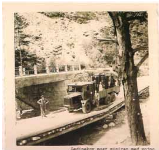
Ledinskiy post, zgrajen med vojno