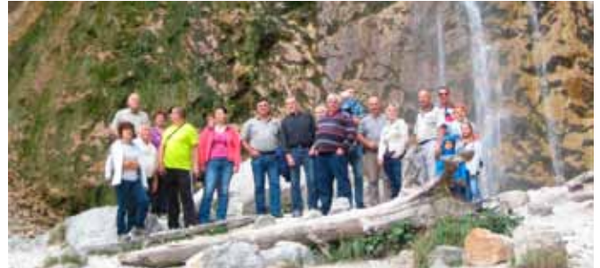
Skupinski posnetek pod slapom Rinka.

Naš zadnji postanek je bil v Nazarjah v lokalu Diva's Caffè, kjer so nas člani družine Zupanc presenetili in pogostili s hrano in pijačo, za kar se jim vsi prisotni