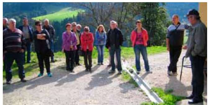
Na kmetiji Selišnik.

Fotografije in tekst: David Ožek, tajnik ZŠAM Laško