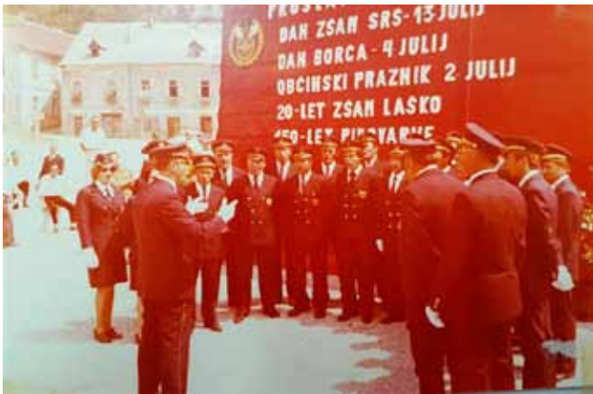
Praznovanje 20. in 40. obletnice delovanja ZŠAM Laško

odgovornost, saj so poleg svojega dela opravljali še prostovoljno delo v društvu, se je takratno vodstvo odločilo za prenehanje te dejavnosti. Med drugim je združenje v prvih letih prireditve Pivo in cvetje aktivno sodelovalo pri pripravi in programu. V tem času so se organizirale dve tomboli, kar nekaj let so se izvajali srečelovi, urejanje prometa in pobiranje parkirnine. Prav tako je ZŠAM sodeloval pri vseh večjih prireditvah v Laškem z urejanjem prometa in parkiranjem. V preteklosti je bilo več druženja, sodelovanja in povezanosti. Organizirani so bili šoferski plesi, veselice, pikniki in vse je bilo zelo dobro obiskano, danes pa se vse bolj oddaljujemo drug od drugega. Ni več usklajenosti, premalo je medsebojnega zaupanja in sodelovanja. Društvo je doživljalo vzpone in padce, vendar s trdno in odločno voljo se je po zaslugi vodstev ohranilo do danes. Trenutno je v društvo včlanjenih 63 članov, od tega je 20 uniformiranih, ki zelo dobro sodelujemo z ostalimi uniformirani člani ostalih združenj v naši okolici, predvsem z društvu, s katerimi smo vključeni v novo NZZŠAM Slovenije. Združenje vsako leto organizira izlet ali piknik za člane in njihove družine. Zadnje čase je udeležba čedalje bolj skromna, saj starejši pešamo, mladi pa nimajo več denarja, časa in želje po medsebojnih druženjih.