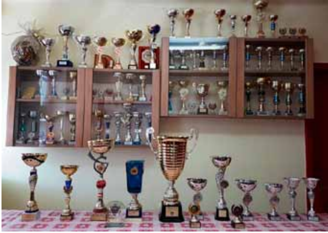
Z leti je vedno bolj polna tudi vitrina s pokali