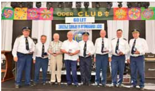
60 let delovanja ZŠAM Laško