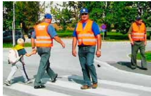
Varovanje otrok na 1. šolski dan

Društvo ves čas aktivno sodeluje z SPV–jem, AMD–jem in policijsko postajo Laško. Delujemo v komisiji za izboljšanje prometne ureditve, signalizacije, vzgoji otrok, Kaj več o prometu in na kolesarskih izpitih. Sodelujemo pri varovanju otrok na prvi šolski dan, kjer skupaj s policiisti iz Laškega posvečamo posebno pozornost predvsem najmlajšim udeležencem v prometu. Varujemo 14 dni na različnih lokacijah v občini Laško, pri prehodih čez cesto in pri postajališčih pri šolah.